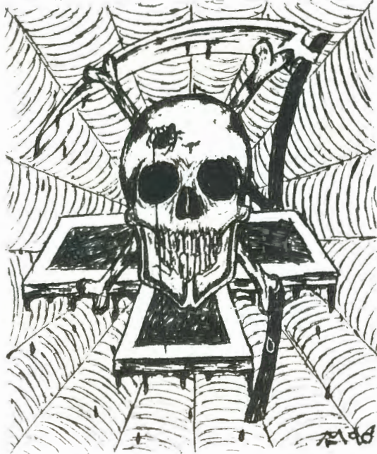
ULTRAMETAL - 1990 - MONITOR

Debustrol „Antikrist“ a „Protest“, Kabát „Za feudála trest“ a „Má jí motorovou“, Morrrior „Termonukleární jatka“ a „Vendeta“, Master's Hammer „Zapálili jsme Onen svět“ a „Génové“, Ferat „Warning you!“ a „There's only a little time“, V.A.R. „Proti vizím“ a „Poslední sen“