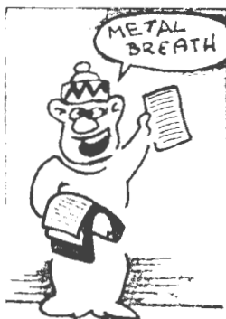
Metal Breath 9